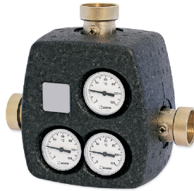
Model VTC 531