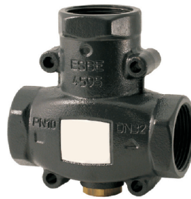
Model VTC 511

Vi anbefaler at udstyre ventiltilslutningerne med kuglehaner (inkluderet i model VTC 531). Dette vil lette fremtidig service.